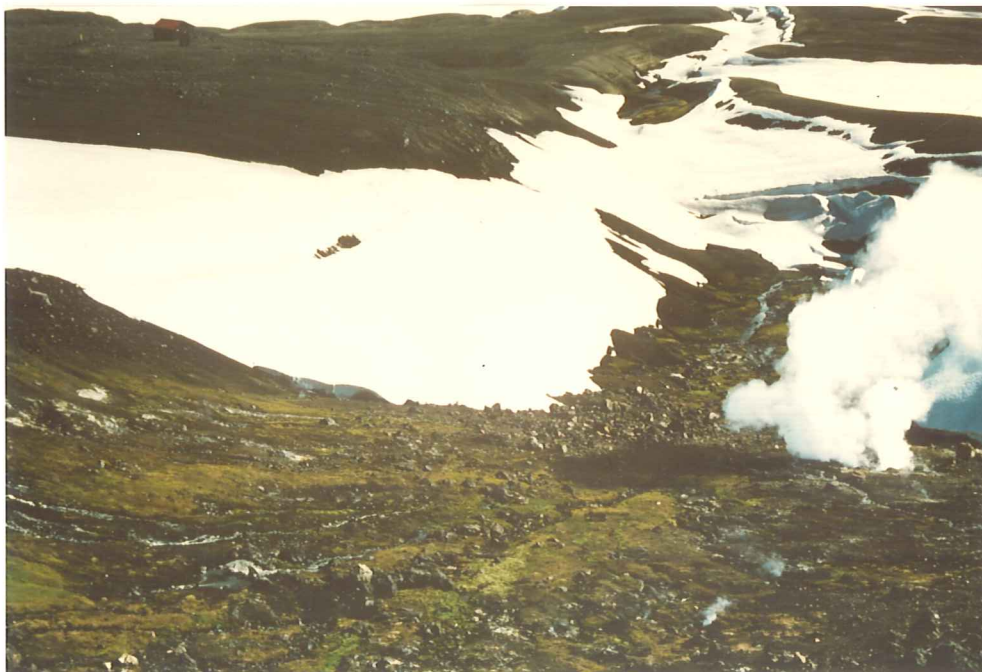
Mynd 2. Ljósmynd af skála Ferðafélags Íslands í Hrafninnuskeri. Kröftugasti gufuhverinn er til hægri á myndinni. Skafi er í brekkunni, þótt myndin sé tekin 14. sept. Fjarlægð frá gufuhvernum í skálann er 190 m í beinni línu.