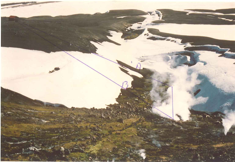
Mynd 3. Ljósmynd sem sýnir lagnarleiðir A og B frá gufuhvernum að skálanum.