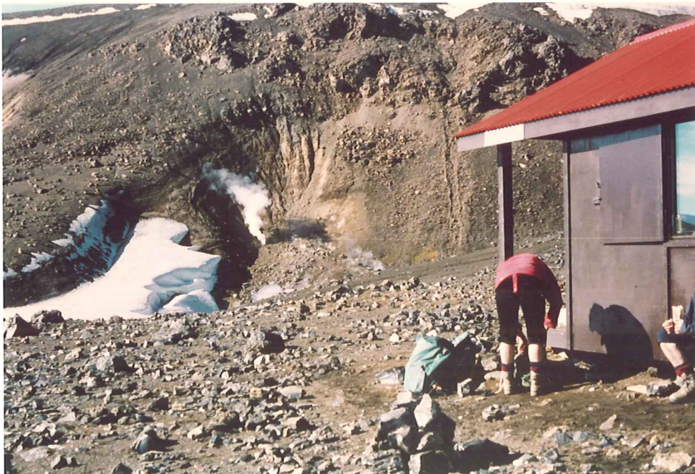
Mynd 6. Séð frá skála F.Í. að gufuhvernum í hlíðinni.