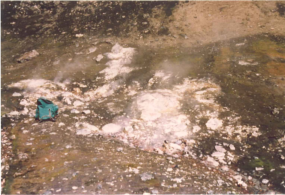
Mynd 5. Nærmynd af gufuhvernum í Hrafninnuskeri. (Ljós. K.S.)