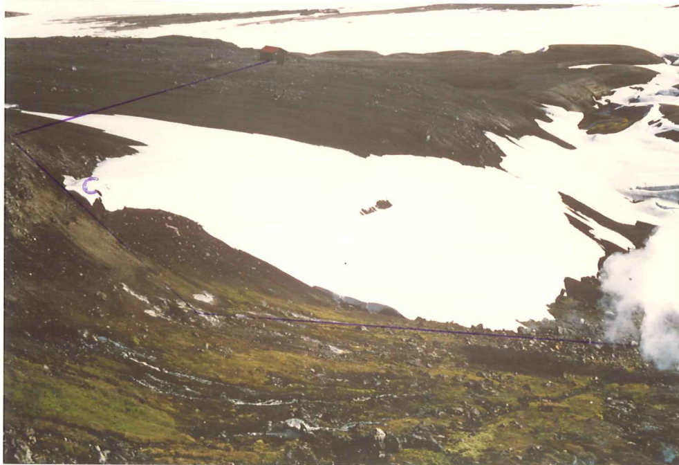
Mynd 4. Ljósmynd sem sýnir lagnarleið C.